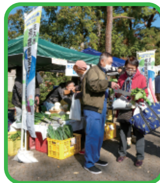
購入者に堆肥の説明をする様子