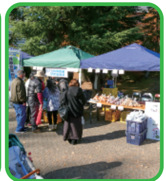
にぎわう販売ブース