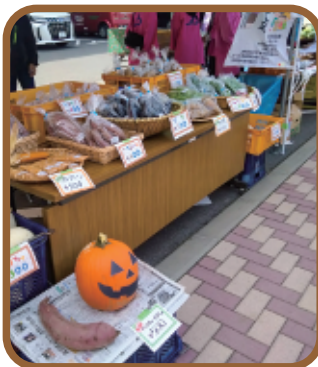
販売ブースに並ぶ新鮮野菜

11月8日に佐久市農業祭が開催されました。当協議会は2年ぶりに参加しました。野菜を購入いただいた方には、当協議会の実験農場でも使用している佐久市堆肥製産センターの堆肥を配布し、有機農業の循環の大切さも紹介しました。