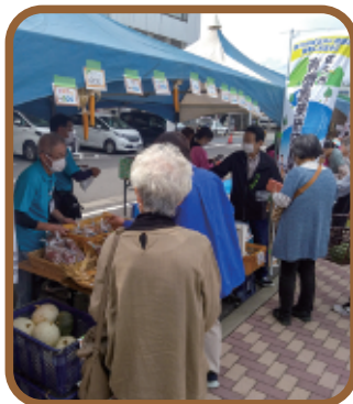
会話が弾む販売風景